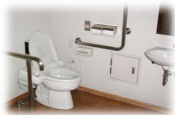
各居室にトイレ・洗面所設備あります。