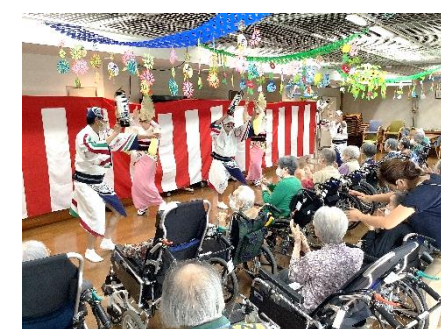
阿波踊りを見る会